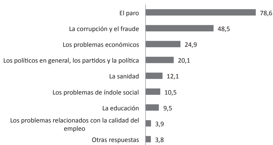
GRÁFICO 1 PRINCIPALES PROBLEMAS DE ESPAÑA EN FEBRERO 2015 EXPRESADOS EN PORCENTAJE

Resulta paradójico que especialmente las preocupaciones más destacadas, el paro y la corrupción, sean consecuencia directa del fracaso del sistema educativo. No me resisto a ilustrar esta situación con el proverbio de Confucio: «cuando el sabio señala a la luna, el necio mira al dedo», pues es evidente que la universidad: ni ha despertado el emprendimiento, la investigación y el empuje para generar puestos de trabajo; ni ha elevado la conciencia social en la deshonor de la corrupción y el fraude; ni, a la vista