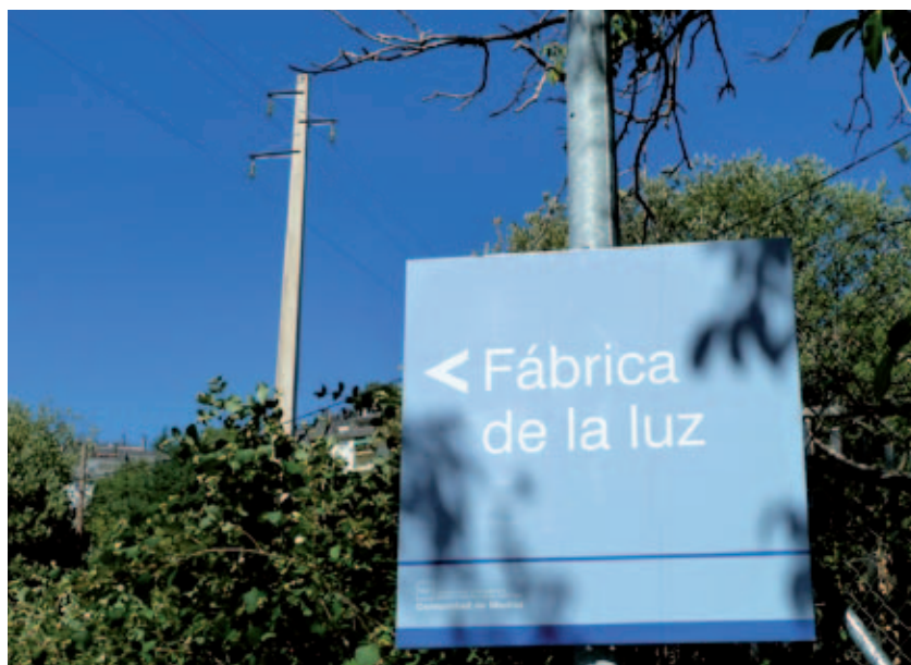
La expresión "fábrica de la luz", muy utilizada para pequeñas centrales hidráulicas que alimentaban núcleos de población próximos, refleja un curioso enfoque mercantilista de la electricidad.

Para la generación y la comercialización se establece el mercado eléctrico, en el que la energía eléctrica, como una mercancía más, queda sometida a la oferta y la demanda, cuyo casamiento determina su precio. La regulación correspondiente deberá velar, como en cualquier otra actividad mercantil, por la existencia de suficiente competencia, actuando contra las situaciones